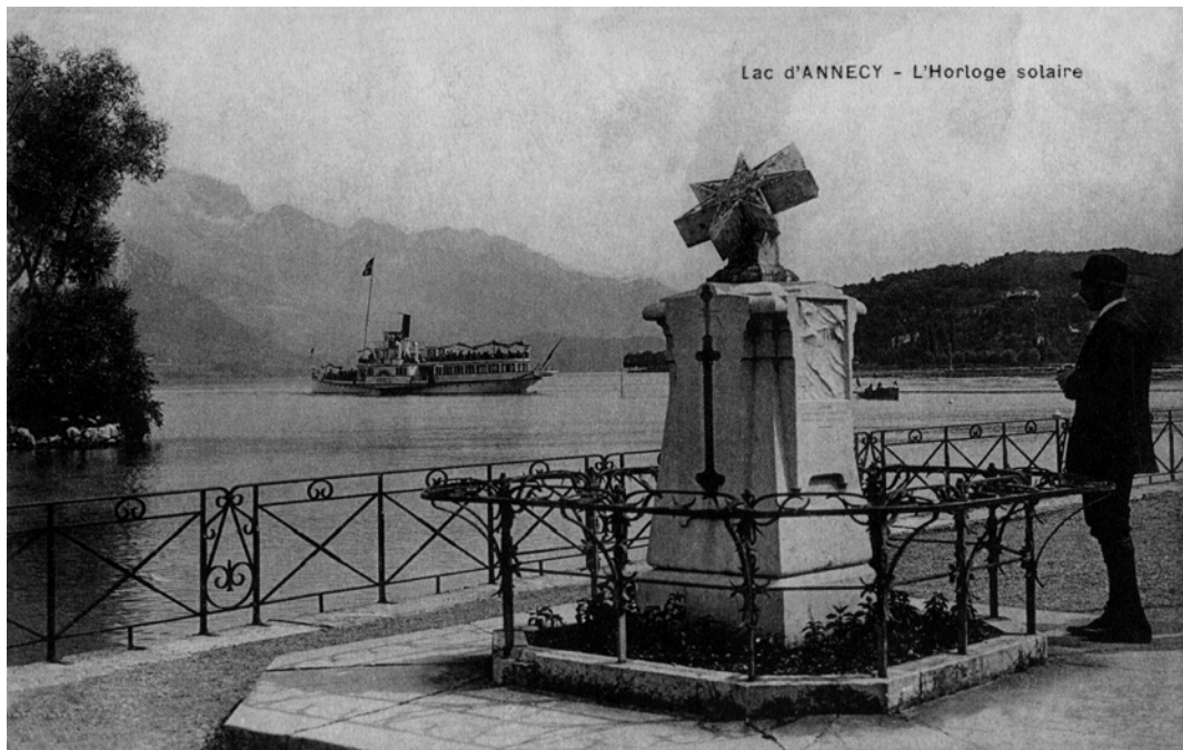
Lac d'ANNECY - L'Horloge solaire